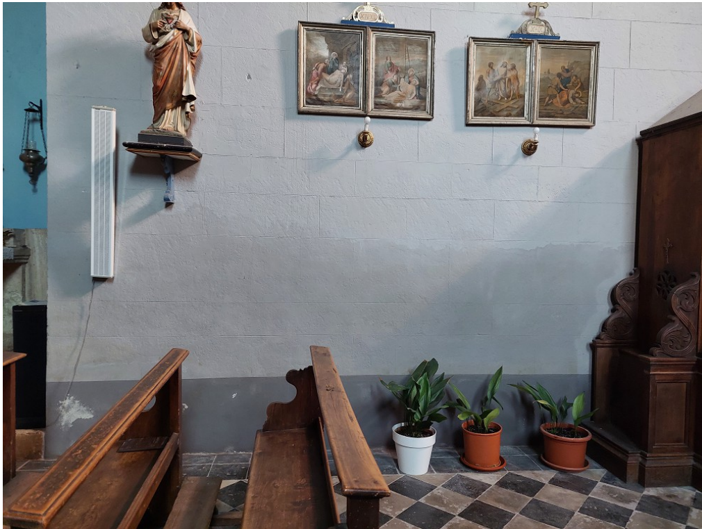
Particolare della parete destra con fenomeni di umidità di risalita

Strada di Cerchiaia, 36 53100 Siena - tel. 0577/45761 archbratto@gmail.com