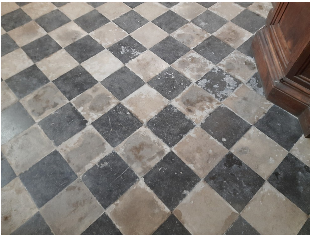
Particolare del pavimento della chiesa

➔ risalita dell'umidità dal terreno sottostante il pavimento della chiesa, a causa della mancanza di un vespaio o intercapedine aerata. Le conseguenze che questo fenomeno provoca sono ben visibili sul pavimento, le cui piastrelle di cemento colorato bicromo, sono fortemente deteriorate a causa in particolare dai sali solubili che vengono veicolati attraverso le molecole di acqua che dal terreno arrivano sulla superficie pavimentata. Questo fenomeno si estende poi anche sulle murature perimetrali, deteriorando gli intonaci.