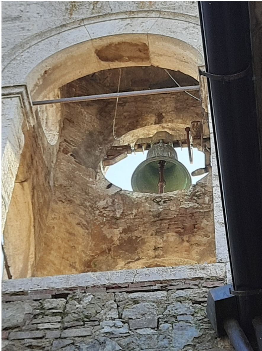
Particolare della cella campanaria

Strada di Cerchiaia, 36 53100 Siena - tel. 0577/45761 archbratto@gmail.com