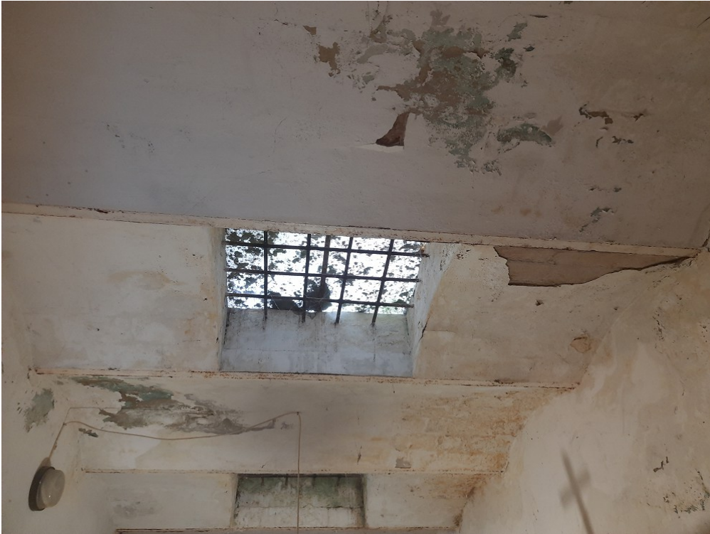
Particolare del soffitto della sagrestia

Strada di Cerchiaia, 36 53100 Siena - tel. 0577/45761 archbratto@gmail.com